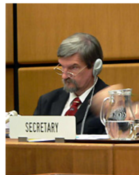
Dr. Both Előd az ENSZ Világűrbizottságának elnökségében

Az ülések kötött, előre meghatározott napirend alapján folynak. Az általános véleménycsere keretében a küldöttek tájékoztatást adnak országaik legfontosabb eredményeiről. Beszámolókat hallgatunk meg arról, hogy milyen másutt hasznosítható melléktermékei vannak az űrkutatásnak (ezek az úgynevezett spin-off eredmények). Külön napirend foglalkozott a "Világűr és víz" problémakörével, itt az országok átadják egymásnak tapasztalataikat, mit adhat az űrtechnika a víz, mint veszélyforrás, vagyis az árvizek, helyizek elleni